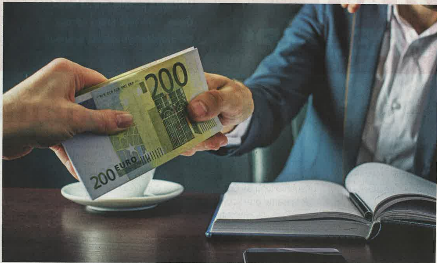
Oznamovateľov korupcie a inej protispoločenskej činnosti bude po novom chrániť nový úrad.

Praktickou zmenou ohľadne kontroly dodržiavania zákona je zavedenie novej pokuty do dvetisíc eur. Tú môže dostať zamestnávateľ, ak urobí voči chránenému zamestnancovi nepriaznivý