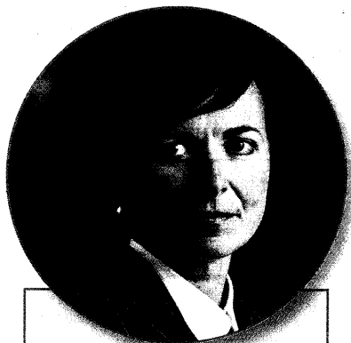
LENKA BRADÁČOVÁ, vrchní státní zástupkyně v Praze