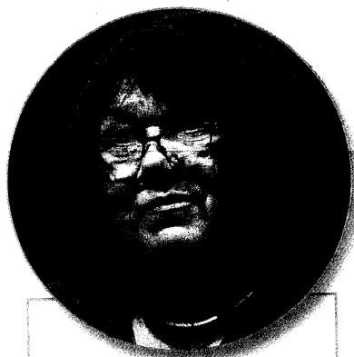
ELIŠKA WAGNEROVÁ, senátorka