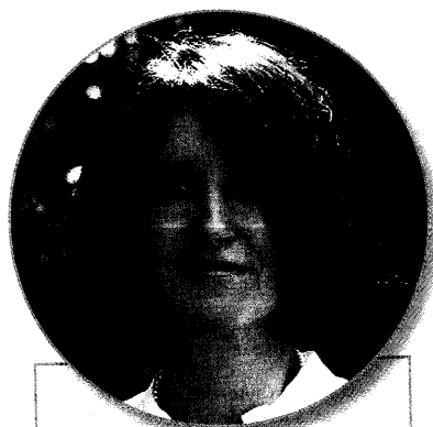
KATEŘINA ŠIMÁČKOVÁ, soudkyně Ústavního soudu