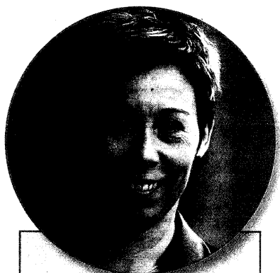
PAVLA FUČÍKOVÁ, prezidentka Exekutorské komory ČR