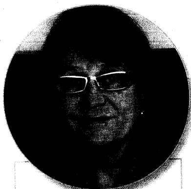
ANNA ŠABATOVÁ, veřejná ochránkyně práv